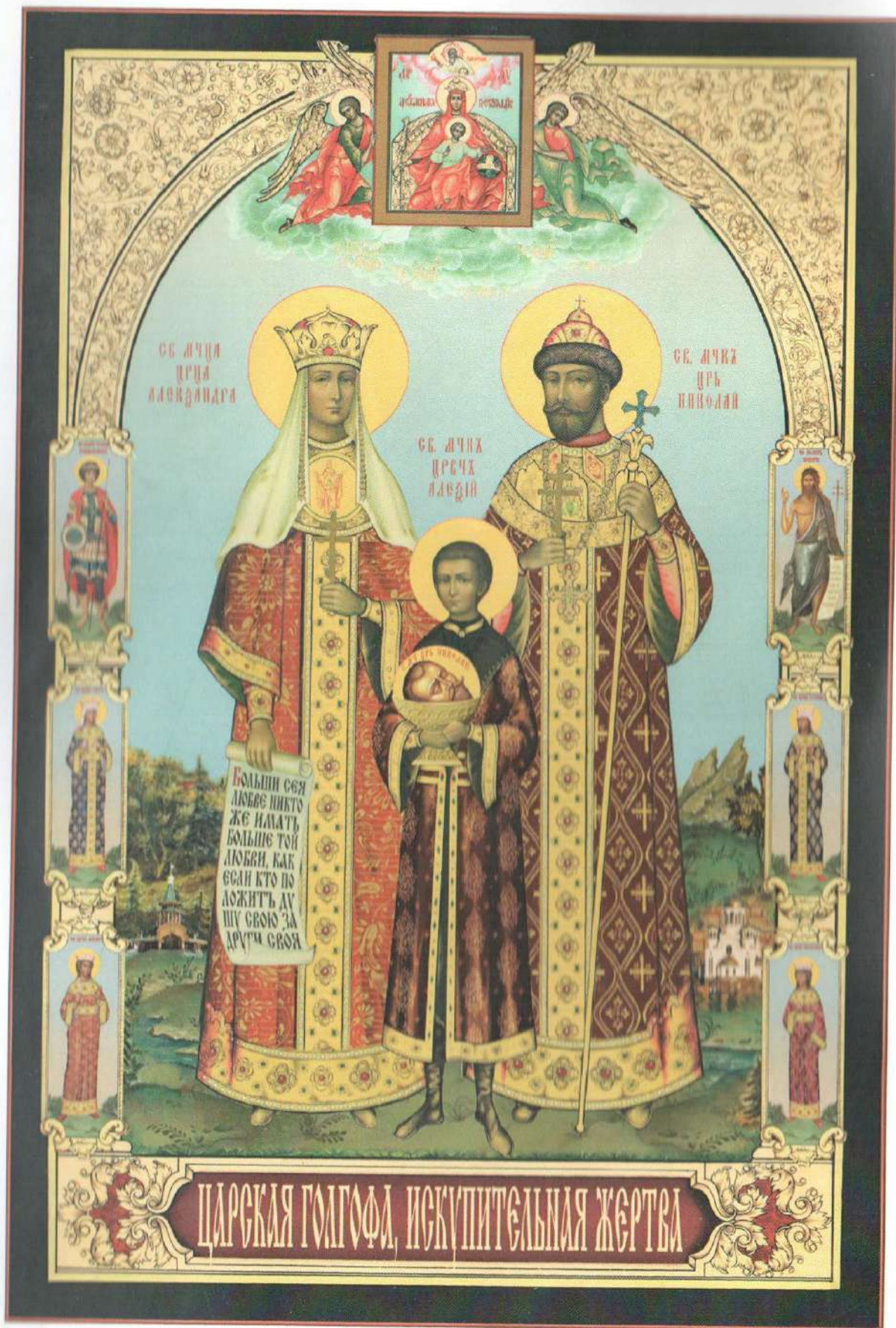
Икона «Царская Голгофа» в храме Воскресения Христова в Кадашах в Москве